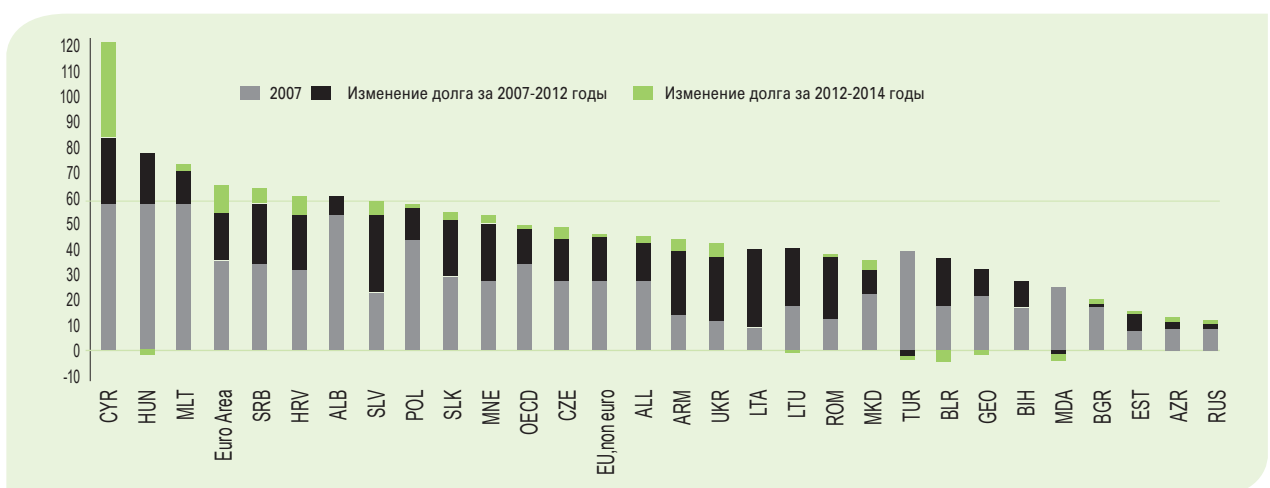
РИС. 2. УРОВЕНЬ ГОСУДАРСТВЕННОГО ДОЛГА В 2007, 2012 И 2014 ГОДАХ, В % К ВВП