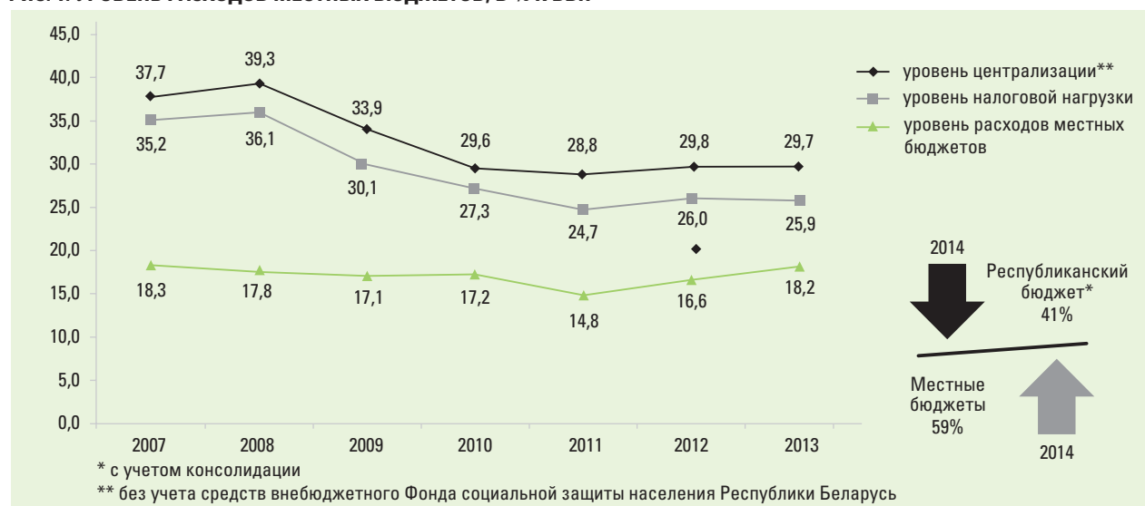
РИС. 1. УРОВЕНЬ РАСХОДОВ МЕСТНЫХ БЮДЖЕТОВ, В % К ВВП

Таким образом, уровень местных бюджетов Беларуси является оптимальным с точки зрения лучшей мировой практики и приближается к своему максимуму с учетом степени централизации средств в бюджете.